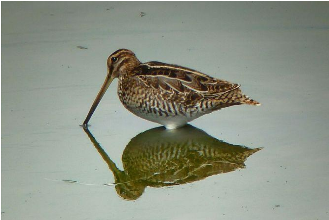
Bild. 1: Bekassine 27.07.2015 Gronauer Masch