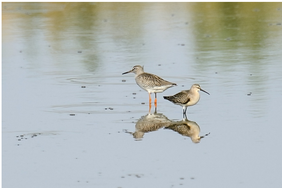
Bild 1: Rotschenkel mit Sicherstrandläufer 22.08.2013 Gronauer Masch.