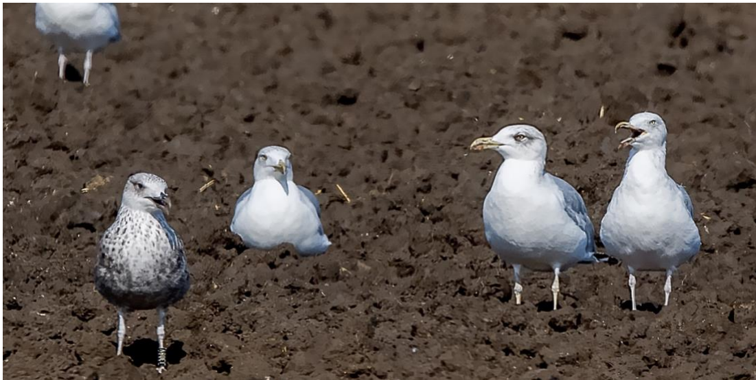
Bild 1: Steppemöwen 03.09.2016 Kemme neben Imm. Heringsmöwe