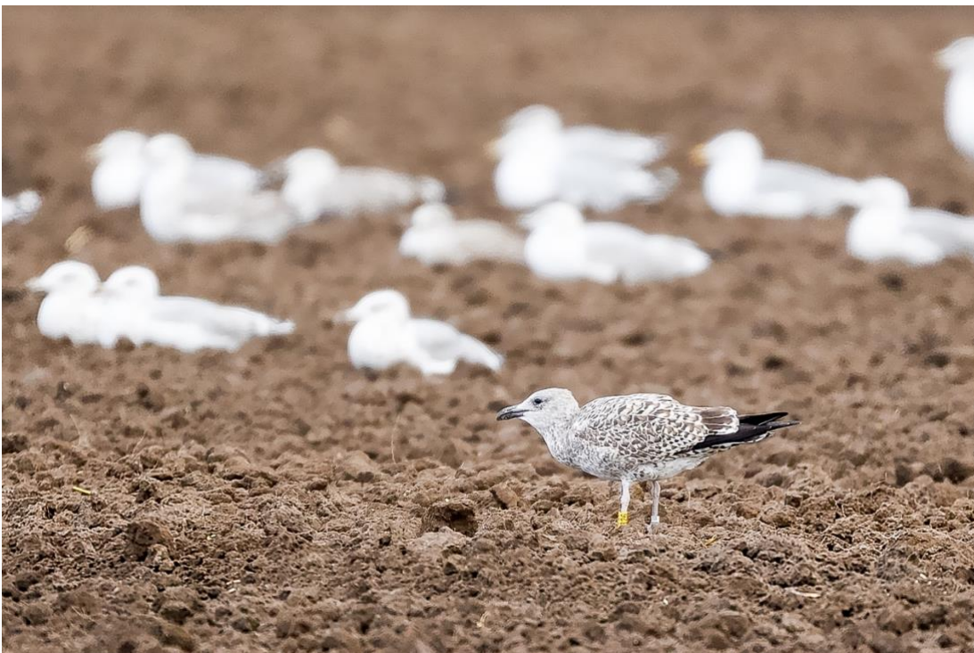
Bild 3: Silbermöwe oder Steppenmöwe? dj. 03.09.2016 Kemme