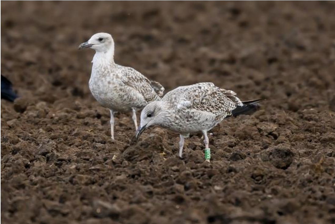
Bild 4: Silbermöwe oder Steppenmöwe? 03.09.2016