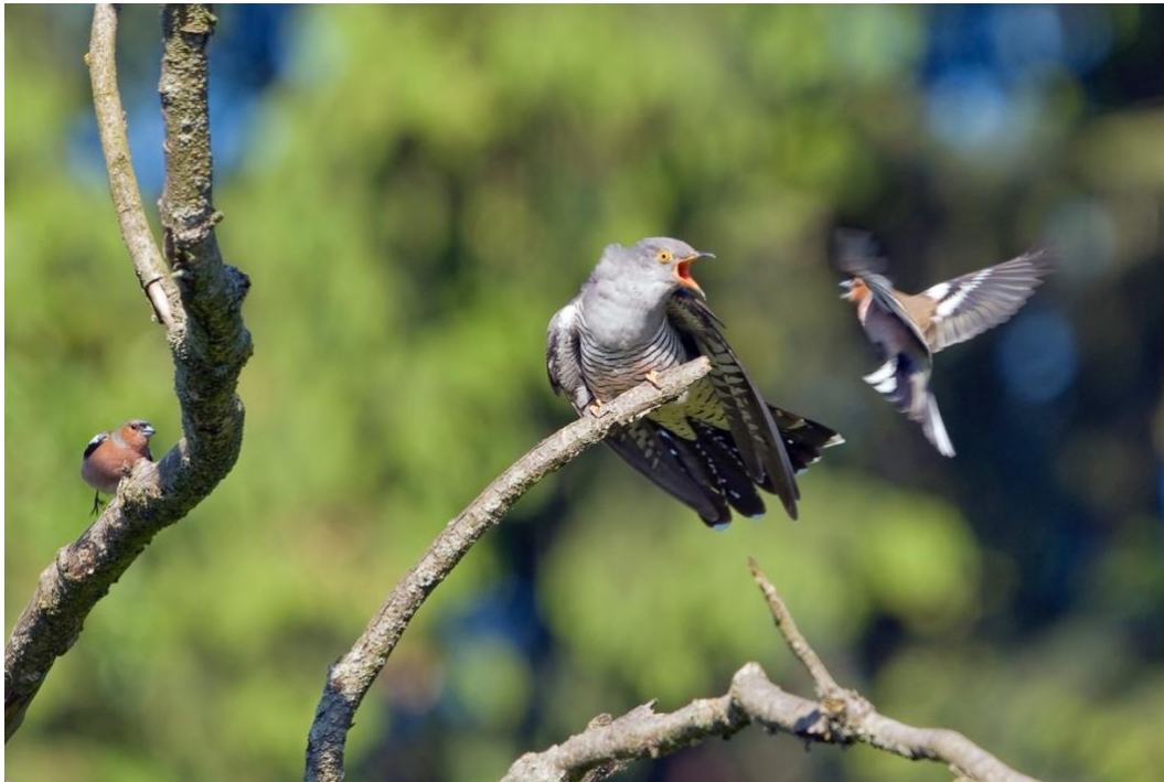
Bild 1: Kuckuck Ad. wird von Buchfinken angegriffen.

In 2016 gab es keine Meldung aus dem Monat Juli. Die letzte Brutzeitmeldung stammte von Rosanowski am 30.06.2016 2 Ex., Hildesheim Blauer Kamp. Erst 48 Tage danach gelang Risch die Feststellung eines Adulten am 13.09.2016 in Ahrbergen Feldmark Ost, Giesen.