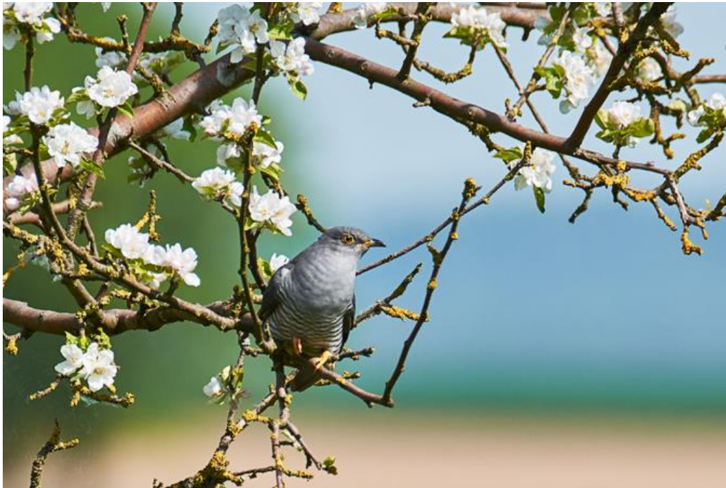
Bild 2 Kuckuck Lamspringe NO