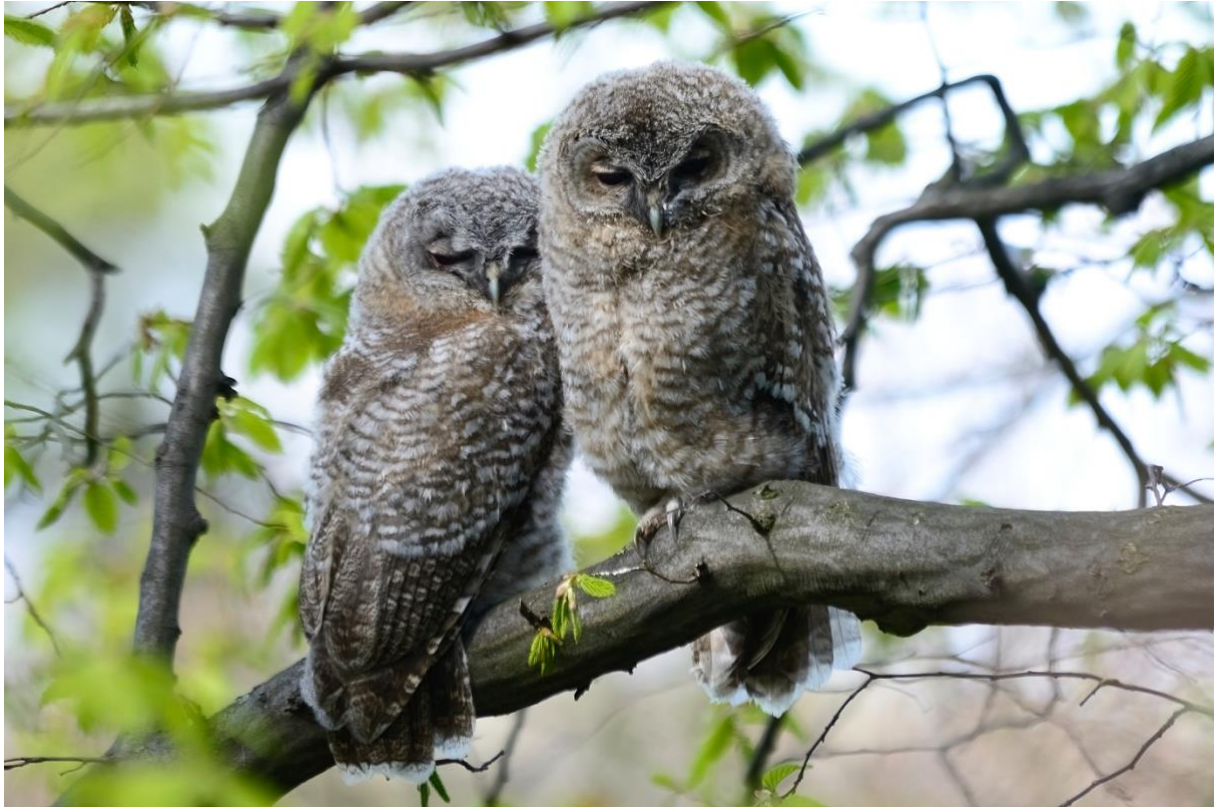
Abb. 1: Waldkauz 2 Pulli Liebesgrund Hildesheim 12.04.2012