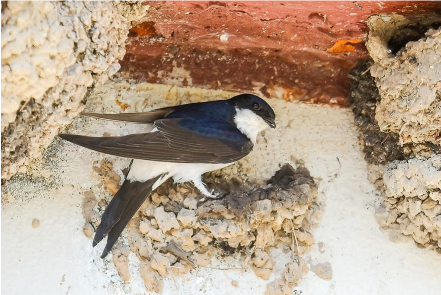
Bild 1: Mehlschwalbe Henneckenrode 18.06.2014

Die Mehlschwalbe wurde in den letzten Jahren wenig beachtet. Das Verschwinden vieler Brutplätze ist nicht wahrgenommen worden. Es wurden Beobachtungen in der Datenbank Ornitho.de gemeldet, aber wie in der Verbreitungskarte zu sehen ist, wurden Brutnachweise kaum gemeldet. In Abb. 1 sind die grünen Quadrate die Brutnachweise und die gelben Karo die Brutverdachte alle aus Siedlungen.