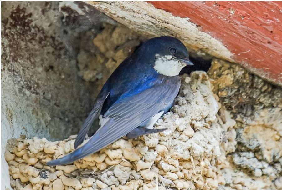
Bild 2: Mehlschwalbe Henneckenrode 18.06.2014