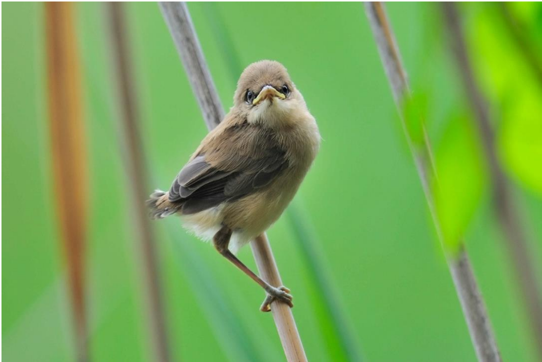
Bild 2: Teichrohrsänger 1 KJ/dj 01.07.2011 Derneburger Teiche