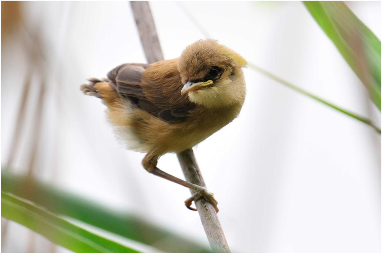
Bild 3: Teichrohrsänger 1 KJ/dj 01.07.2011 Derneburger Teiche