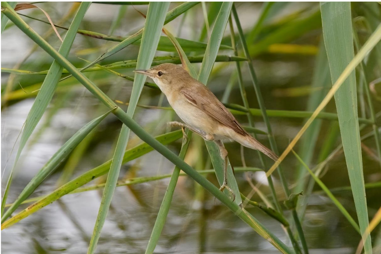
Bild 5: Teichrohrsänger Ad. Derneburger Teiche Mariensee 21.08.2016