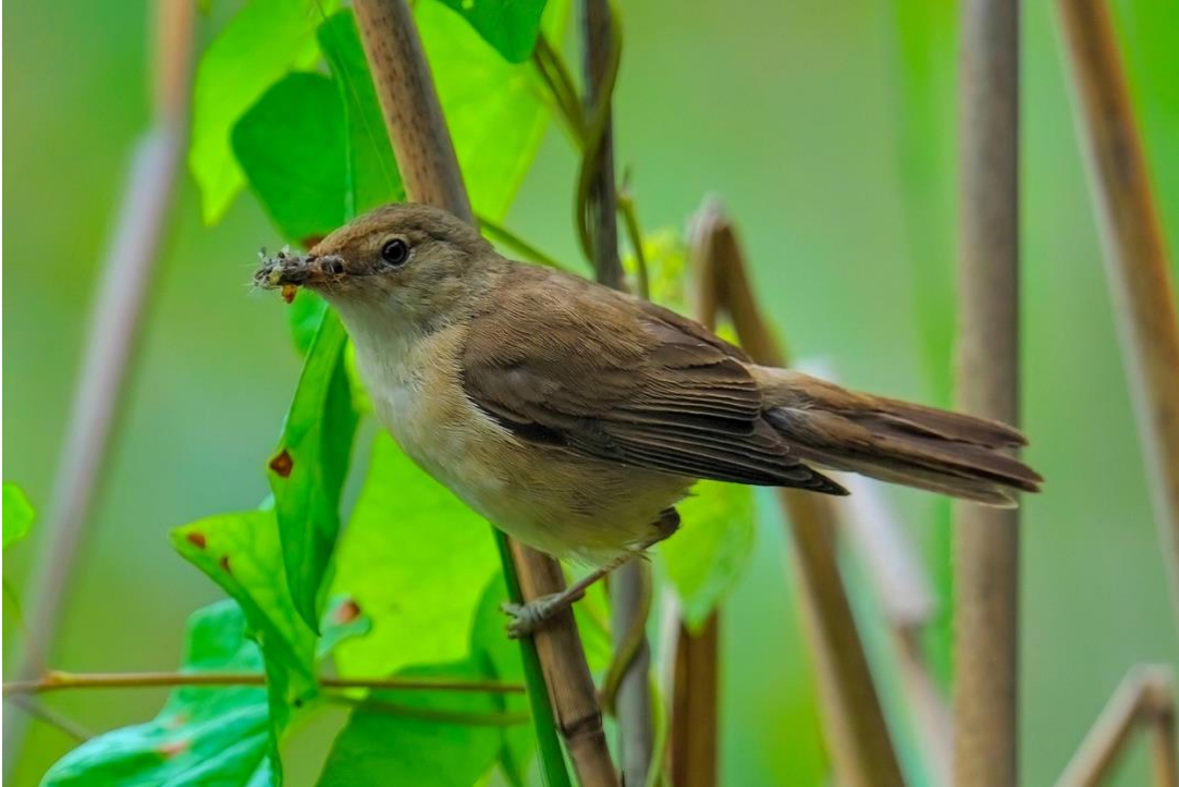
Bild 1: Teichrohrsänger Ad. 01.07.2011 Derneburger Teiche

An nächster Stelle liegt das Gebiet der Derneburger Teiche mit 107 Meldungen. Die restlichen Meldungen stammen von den Schilfstreifen an den Ufern der sonstigen Gewässer und von mit Schilf bewachsenen Feldgräben, vor allem im Nordkreis. Die südlichste Nachweise stammen von den Kiesteichen in Brüggen und von den Teichen der Paul-Feindt-Stiftung in Östrum, Bad Salzedt furth.