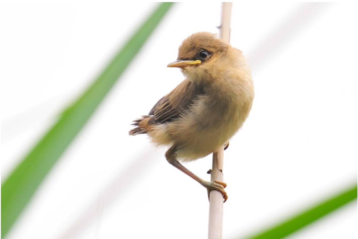
Bild 4: Teichrohrsänger 1 KJ/dj 01.07.2011 Derneburger Teiche