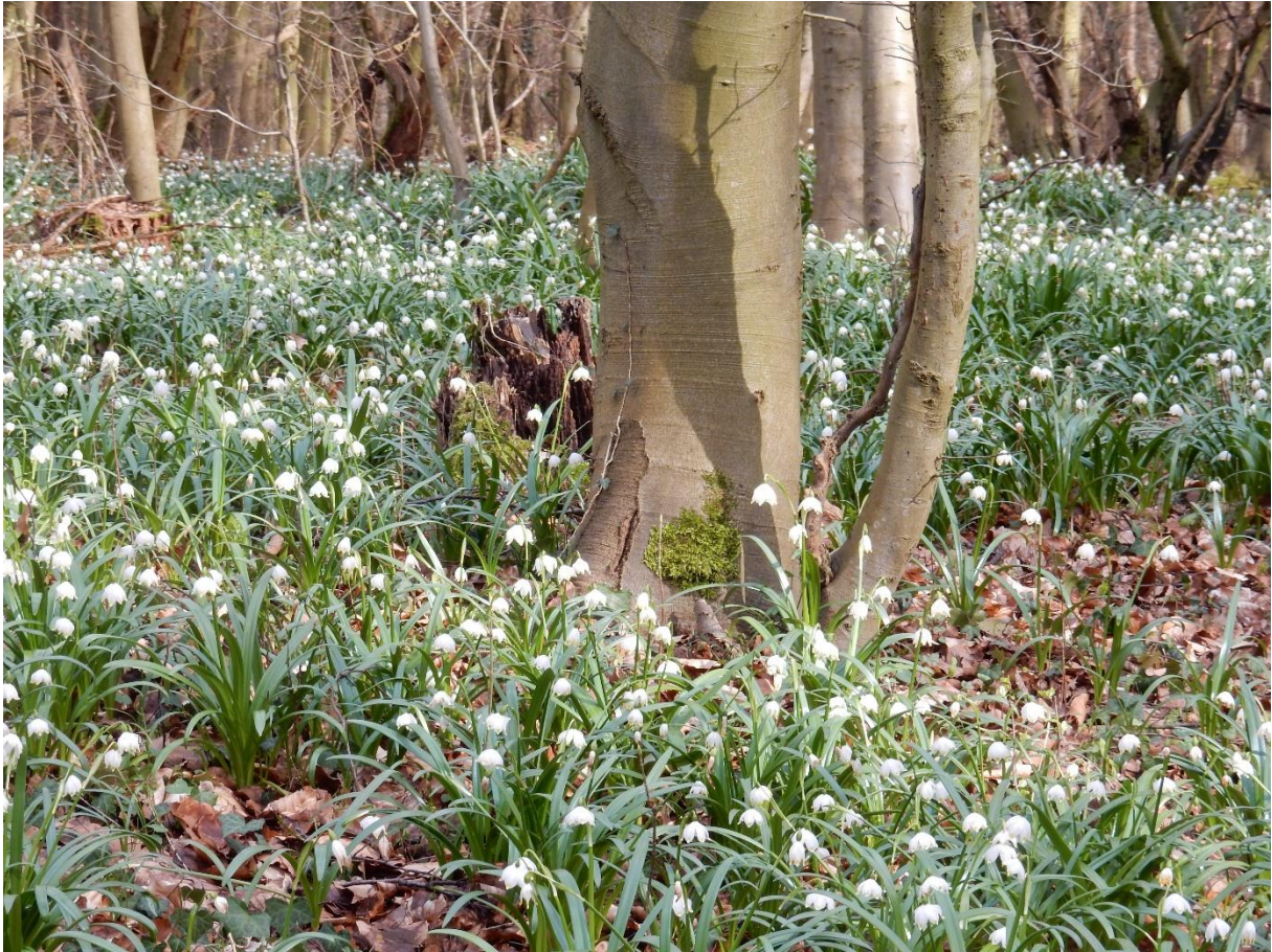
Der Märzenbecher ( Leucojum vernum ) bildet am Riesenberg große Bestände.