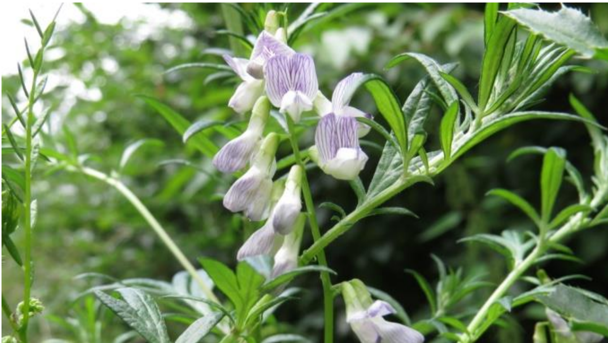
Wald-Wicke ( Vicia sylvatica ).