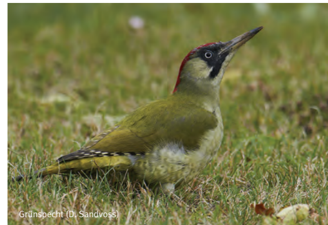
Grünspecht