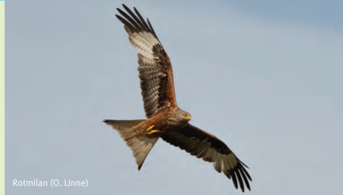
Rotmilan (O. Linne)

Im Kerngebiet des FHH 121 befinden sich die Derneburger Teiche, die von der Paul-Feindt-Stiftung 2007 gekauft worden sind. Hier befindet sich die einzige binnenländische Brutstelle des Mittelsägers in Niedersachsen. Über 200 Vogelarten sind hier nachgewiesen worden. Der Fischwirt sorgt dafür, dass die Teiche mit Fischbestand besetzt werden und dass die Teiche abwechselnd durch ablassen und befüllen ihre Funktion beibehalten. Fachwerkhäuser und eine Wassermühle aus dem Jahr 1598 befinden sich im Gebiet. Das Derneburger Schloss und der Laves-Kultur-Pfad sind in Sicht- und Reichweite. Eine Wanderung auf dem Laves-Pfad ist empfehlenswert. Treffpunkt: 10:00 Uhr, Derneburg, ‚Schlossstraße‘, Beobachtungshütte am ‚Große-Pferdewiesen-Teich‘ Kontakt: Salvatore Bologna, 0157 75192429