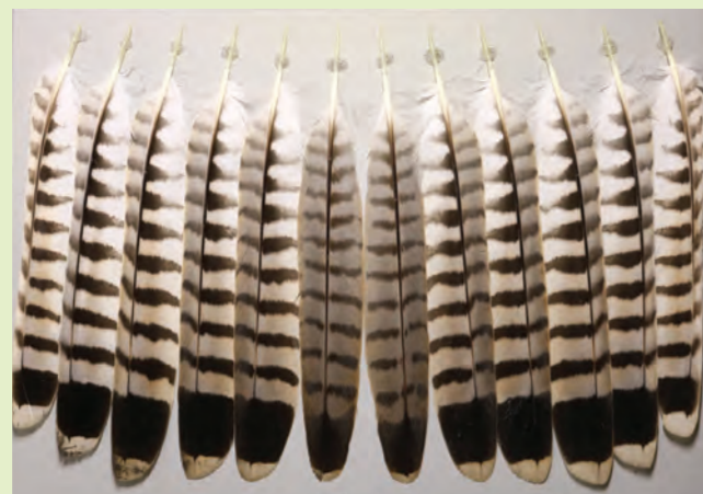
Steuerfedern eines adulten Turmfalkenweibchen (B. Scharfenberg)

Beginn: 19:00 Uhr, „KreisSportBund Hildesheim e.V.“, Jahnstraße 52, 31137 Hildesheim (parken in der Julianen-Aue nahe Schwimmhalle)