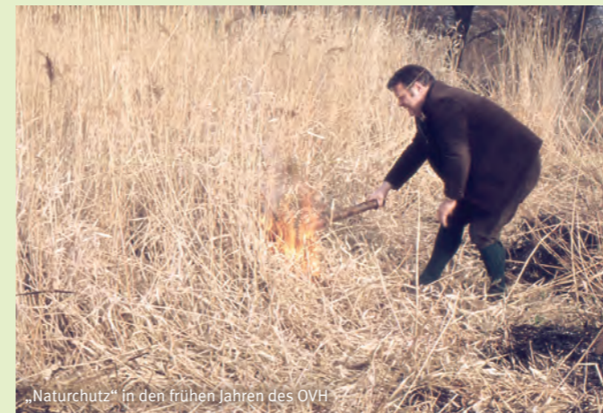
„Naturschutz“ in den frühen Jahren des OVH

Kontakt: Petra Pahl, petra.pahl@ovh-online.de