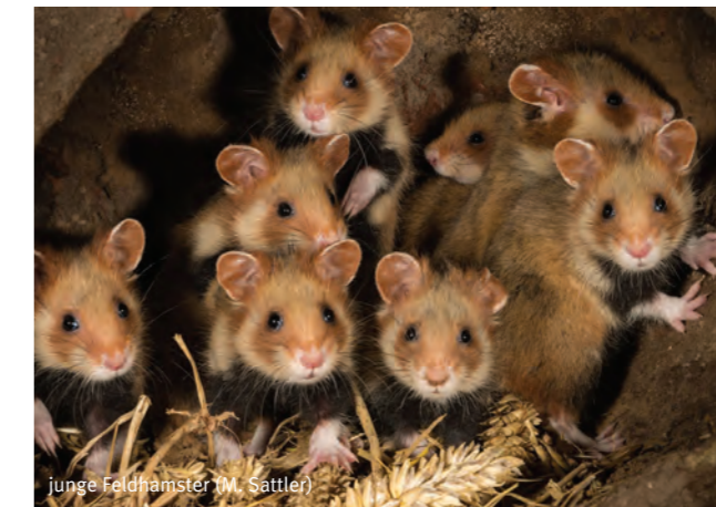
junge Feldhamster (M. Sattler)

Eine Fahrrad-Tour mit dem ADFC zum Osterberg. Die Strecke kann auch von Familien mit Kindern gefahren werden. Spannend wird ein Stopp an der Panzerwaschanlage am Osterberg, um die Urzeitkrebse „kennenzulernen“ und ein Halt am „Libellenflugplatz“ am Mühlengraben. Dann weiter auf der Fahrstraße zum alten Munitionsdepot mit Hinweisen zum Gelände und den verschiedenen geologischen Formationen. Im Munitionsdepot erfolgt die Besichtigung der Bunker und Sichtung der Fledermäuse. Sicher sind auch Schafe, Ziegen und Esel des Pächters vor Ort zu bestaunen. Treffpunkt: 17:00 Uhr, Hildesheim, ‚Lucienvörder Allee 2‘, Tennisstübchen Gelb-Rot neben dem Jo-Bad Kontakt: Hans-Jürgen Pütz, hans.juergen.puetz@ovh-online.de und Michael Struck (ADFC)