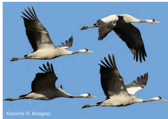
Kraniche (S. Bologna)