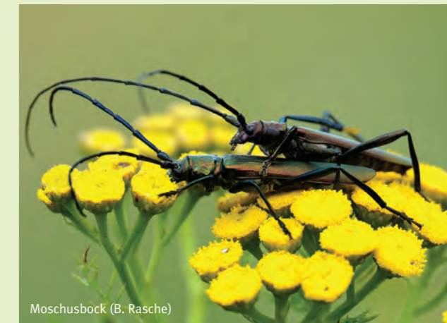
Moschusbock