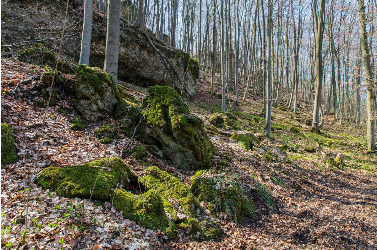
Im NSG „Selterklippen“.