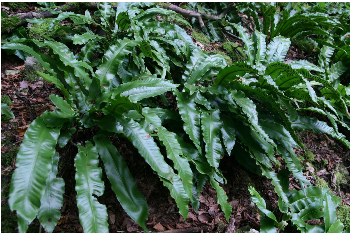
Hirschzungenfarn ( Asplenium scolopendrium), RL 3.

Sowie eine artenreiche Moosflora (Laubmoose, Lebermoose) und Hundsflechten