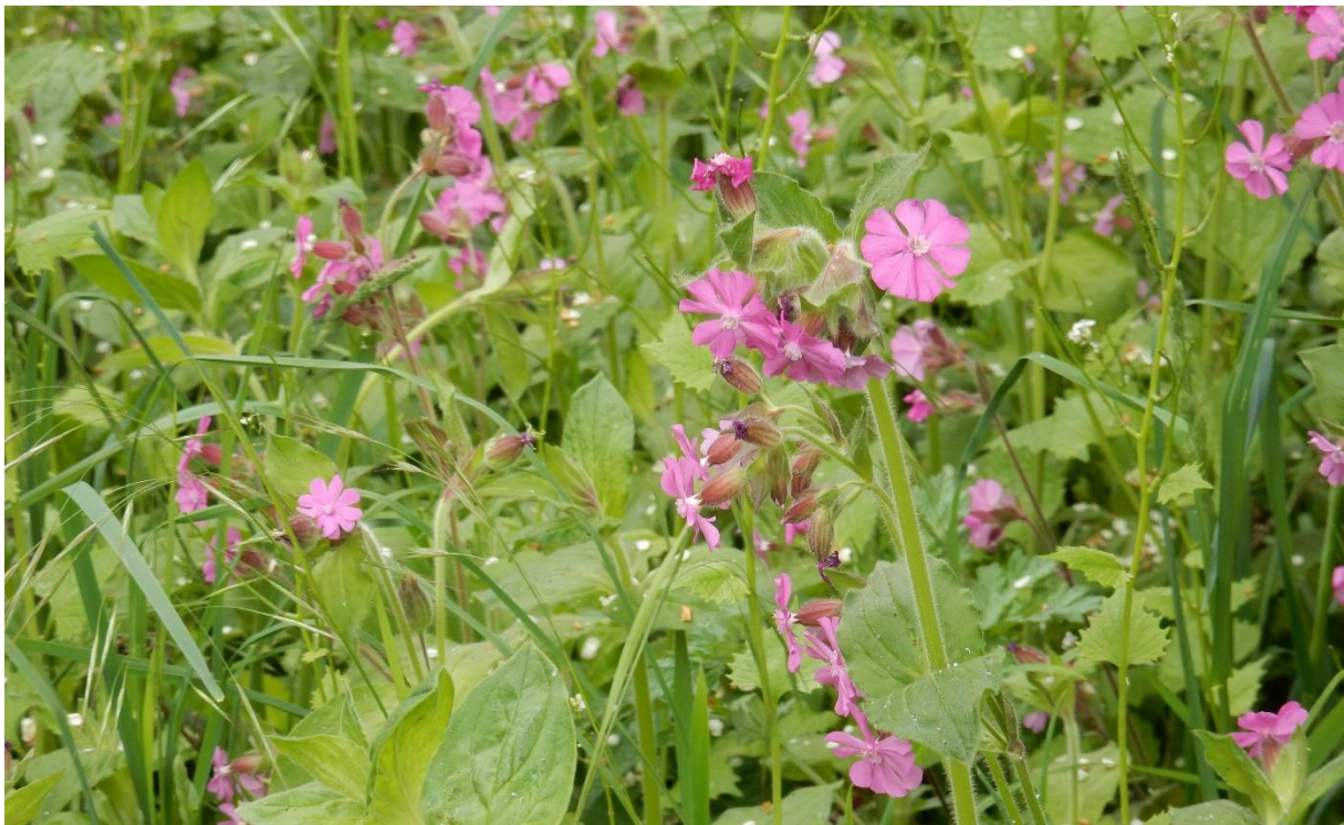
Rote Lichtnelke ( Silene dioica ).

Literatur: H. HAEUPLER, A. MONTAG, K. WÖLDECKE UND E. GARVE (1983): Rote Liste Gefäßpflanzen Niedersachsen und Bremen. Niedersächsisches Landesverwaltungsamt – Fachbehörde für Naturschutz, Hannover.