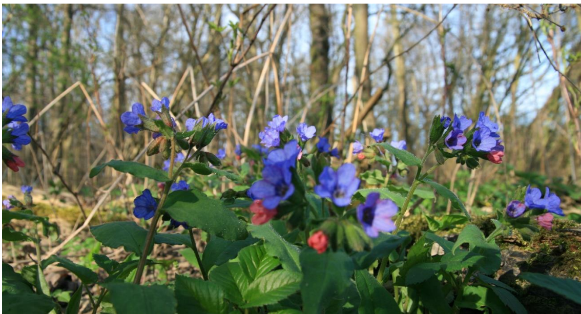
Dunkles Lungenkraut ( Pulmonaria obscura ).